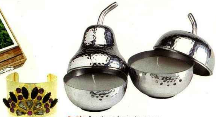
Strassée Manchette dorée. 17 €, Oasis.