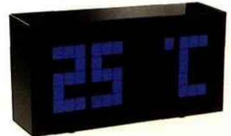
Design Horloge monobloc à LED, qui donne l'heure ou la température. 19,90 €, Carrefour.