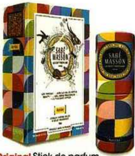
Original Slick de parfum solide. 20 €, Sabé Masson.