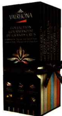
Gourmand Coffret Collection Gourmandise de grands crus. 24,20 € (6 x 85 g), Valrhona.