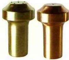
Inséparables Duo salière et poivrière en acier façon cuivre ou doré. H 10 cm. 19 € le duo, Habitat.