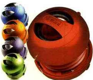
Toute mini ! Baladeuse avec enceinte capsule rechargeable et haut-parleur de 40 mm, autonomie 12 h env. et contrôle du volume, existe en 7 coloris. 29,90 €, X-mini II, Bathroom Graffiti.