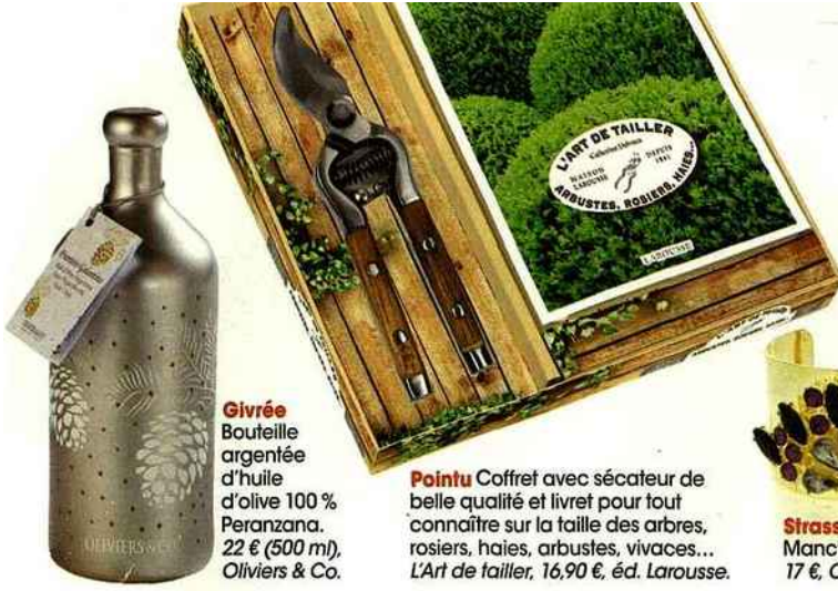
Givrée Bouteille argentée d'huile d'olive 100 % Peranzana. 22 € (500 ml), Oliviers & Co.