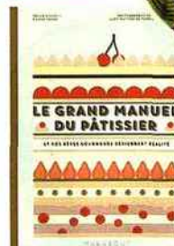
Comme un chef Le plein de douceurs avec Le Grand Manuel du pâtissier . 29,90 €, éd. Marabout.