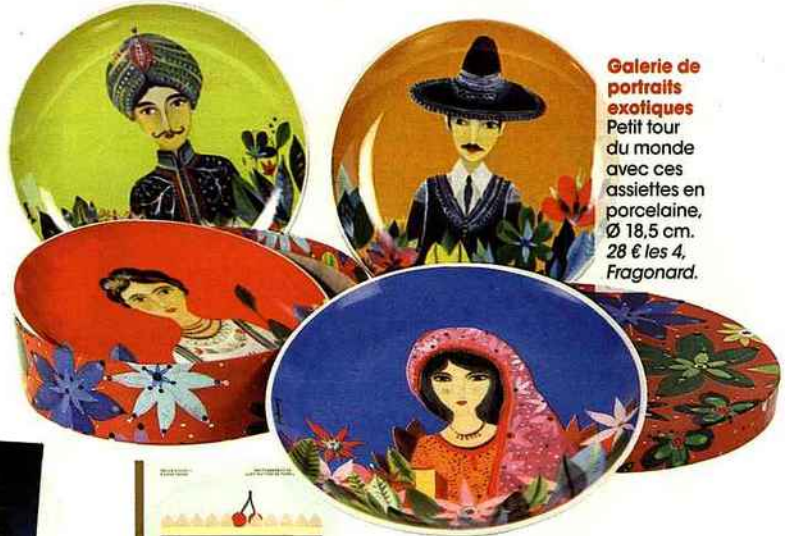
Galerie de portraits exotiques Petit tour du monde avec ces assiettes en porcelaine, Ø 18,5 cm. 28 € les 4, Fragonard.