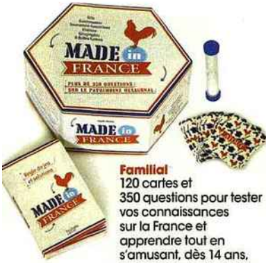
Familial 120 cartes et 350 questions pour tester vos connaissances sur la France et apprendre tout en s'amusant, dès 14 ans. 14,90 €, Hachette Loisirs.